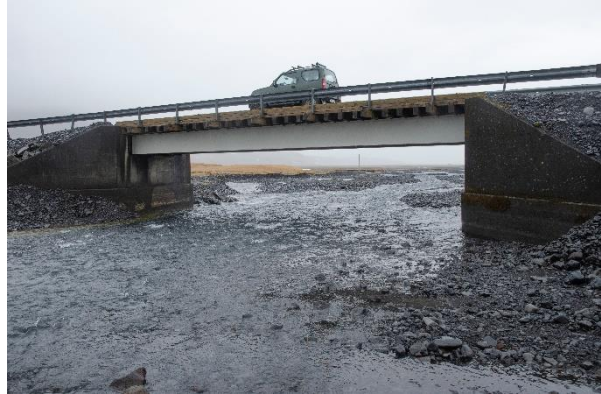
Brúin á Holtsá í febrúar 2023, efní grafið frá endum brúarinnar.