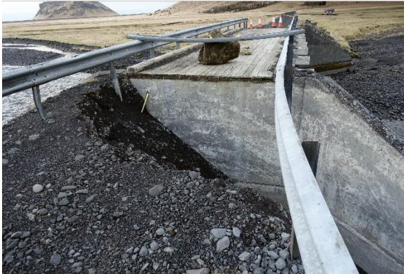
Skemmdir á brúnni á Holtsá í nóvember 2018.

Sama á við um efnisnámu E5 sem er fyrir neðan brú á Klifanda. Þar hefur efnistaka ekki verið undanfarin ár en með því að setja efnisnámu þar, má gera ráð fyrir að sú brú geti einnig verið í hættu.